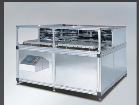
ホットプレート型加熱装置

プレート寸法 (mm) : W700×D600×H40 最高使用温度 : 300°C ガラス基板の加熱/冷却