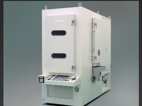
多段積上げ式熱風コンベア炉

寸法 (mm) : W1500×D3600×H2800 最高使用温度 : 190°C 銅箔基板乾燥