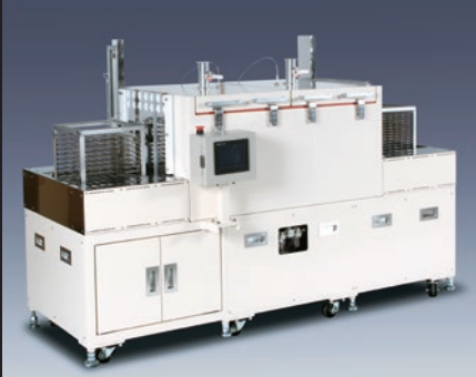
多段式熱風コンベア炉

寸法 (mm) : W700×D2000×H1400 最高使用温度 : 150°C 食品の連続加熱/乾燥/水切 多段ラックサイズのワークの加熱/乾燥