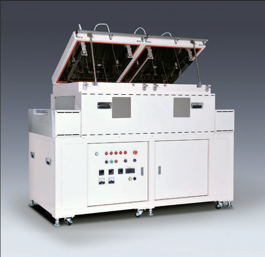
コンベア型遠赤・熱風併用炉 (テスト炉)

弊社工場にて、テスト炉を使用してお客様のワーク加熱試験ができます。詳しくはお近くの (株) 八光電機 支店・営業所または販売会社までお問い合わせください。 寸法 (mm) : W2000×D1000×H1600 / 最高使用温度 : 200°C 接着剤の硬化 / 部品の予熱/加熱/乾燥